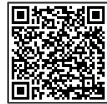
All Learning Content Related to this Topic

Solutions: Good morning. Andreas Horn speaking. / Good morning. This is Lea Schmidt. I would like to speak to Mr. Brandt. / Just a second, I'll check if he is in already. / Thank you. / I am sorry, but Mr. Brandt is not here yet. / Can you tell me when he will be in? / Probably around 4 pm. / Alright, I will call again later then. Thank you. / You're welcome. Goodbye. / Bye.